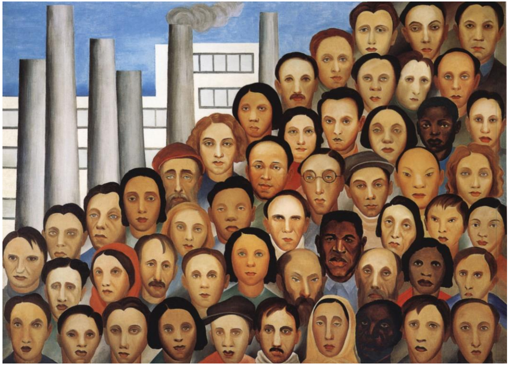
Operários - Tarsila do Amaral, 1933

Dentre as atividades desenvolvidas, destacamos as seguintes: