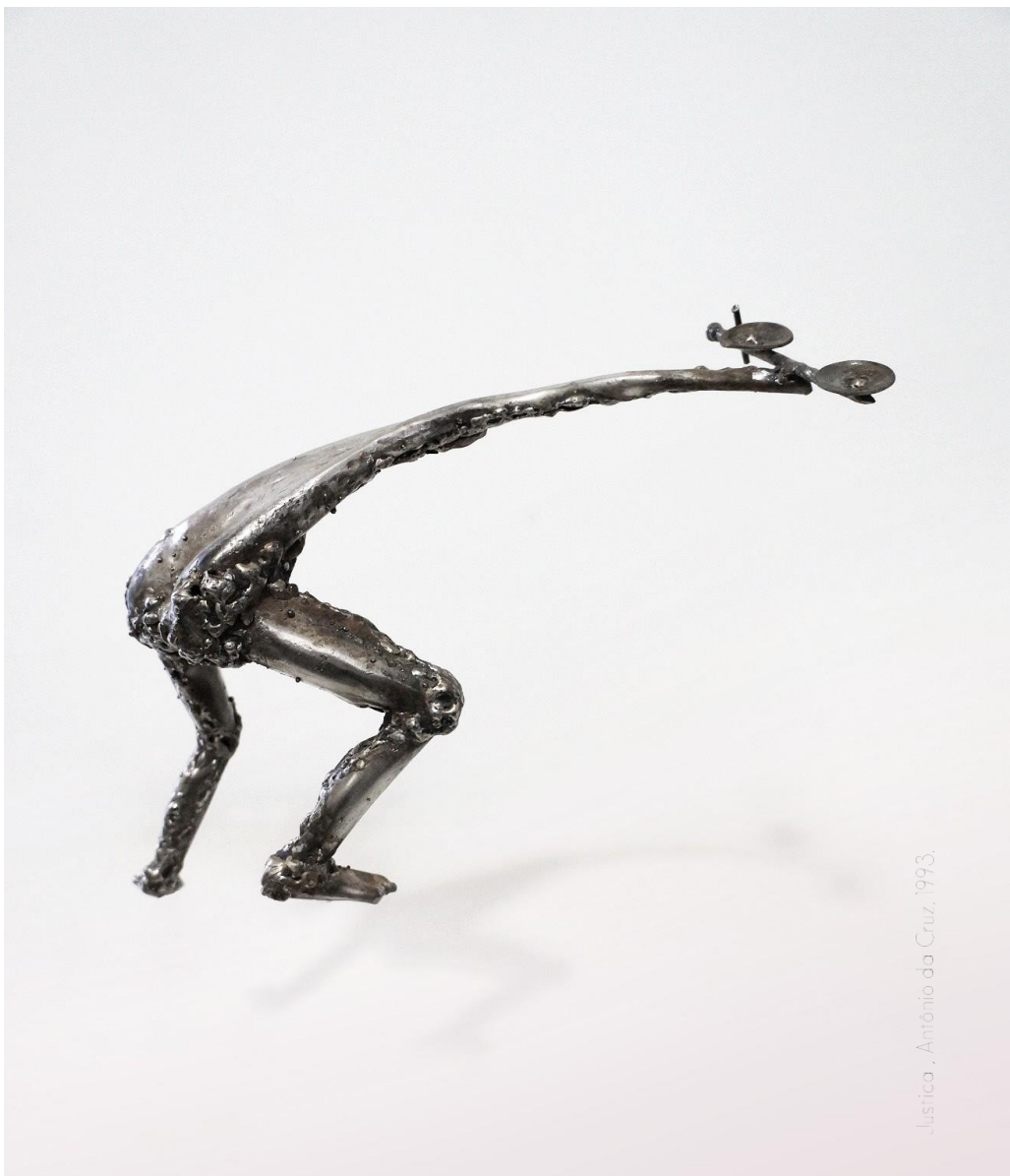
Justiça, Antônio da Cruz, 1993.

A sociedade Cezar Britto & Advogados Associados, agora Cezar Britto Advocacia, foi fundada em 2011, estando regularmente inscrita na OAB/DF sob o nº 1763-10, tendo como finalidade precípua o exercício da advocacia, a defesa jurídica da pessoa humana, a colaboração, a assessoria e o patrocínio judicial de causas individuais e coletivas, que sejam do interesse da cidadania e da preservação do Estado Democrático de Direito.